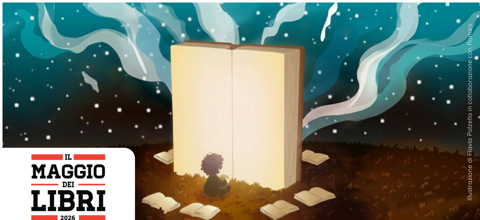
Illustrazione di Flavia Polzella in collaborazione con Romics

Bibliocultura 2.0 Volontari Biblioteca di Lomagna-ODV